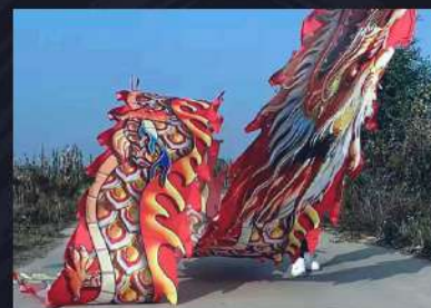
DANZA LISTÓN DRAGÓN