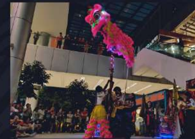
DANZA DEL LEÓN CHINO EN POSTE ALTO