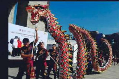
DANZA DEL DRAGÓN CHINO