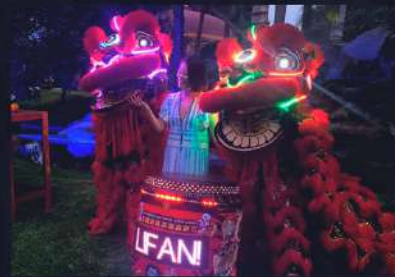
DANZA LEÓN CHINO CON LEDS