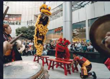
DANZA LEÓN CHINO EN BANCAS