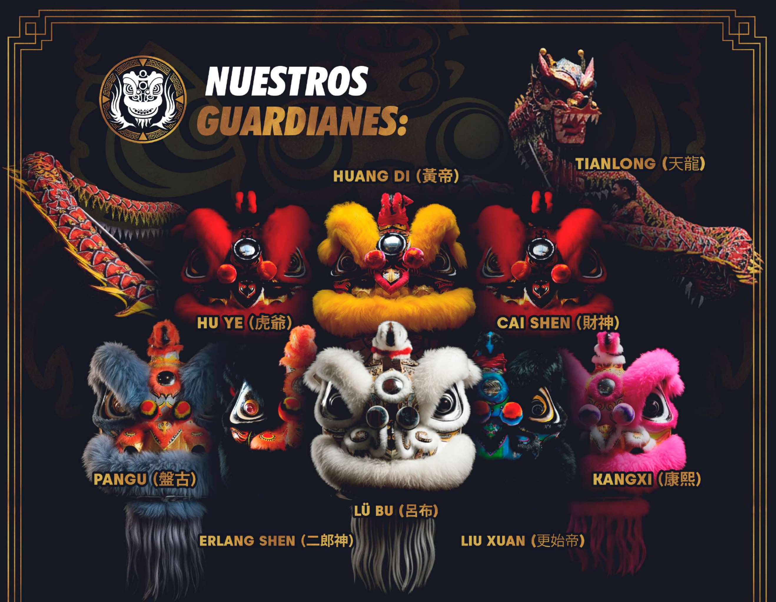
LIU XUAN (更始帝)