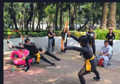
TALLERES DANZA DEL LEÓN CHINO

*El performance está respaldado por personal creativo y practicantes de la tradicional danza, esto con la finalidad de dar un servicio adecuado para cubrir sus necesidades, generando un impresionante espectáculo para su evento o activación.