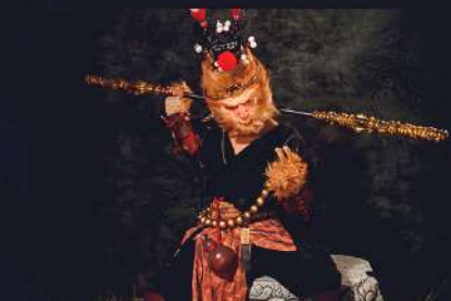
REY MONO VIVIENTE