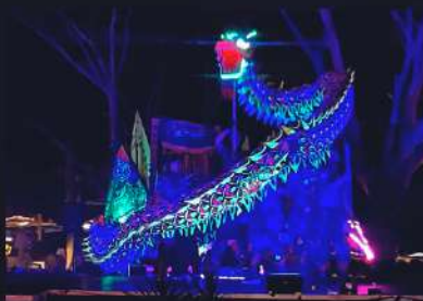
DANZA DEL DRAGÓN LUMINOUS LEDS