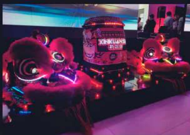
EXHIBICIÓN IMPERIAL (VISUAL)