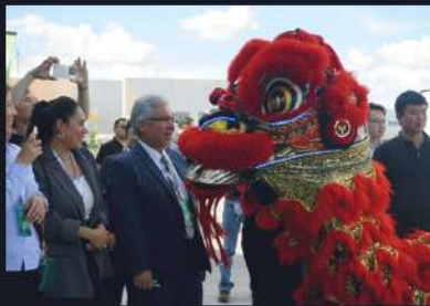
DANZA DEL LEÓN CHINO EN PISO