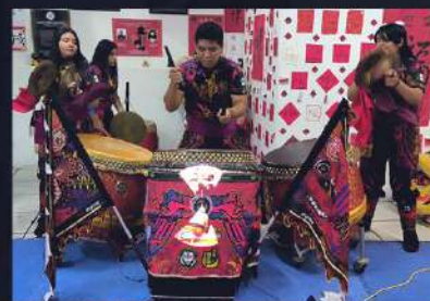
SHOW TAMBORES DE GUERRA