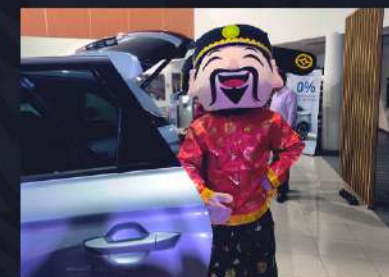
DIOS DE LA FORTUNA (MASCOTA AUSPICIOSA)